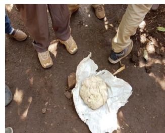
Una «pagnotta» fatta con la corteccia dell'enset

Nel 2021 il numero di persone sottanutrite in Etiopia ha raggiunto i 28,6 milioni (24,9% della popolazione totale), il numero delle persone con grave insicurezza alimentare ha raggiunto i 22,6 milioni (19,6% della popolazione totale) e, nel 2020, il numero di bambini (sotto i 5 anni di età) affetti da deperimento è stato di 1,2 milioni (7,2%) e il numero di bambini (sotto i 5 anni di età) che presentavano ritardi di crescita ha raggiunto i 5,9 milioni (35,3%). In tutta l'Etiopia la povertà rurale è un fenomeno radicato e diffuso e, in particolare, nel Sud.