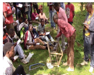
Formazione di agricoltori sulla costruzione di arnie con materiali naturali