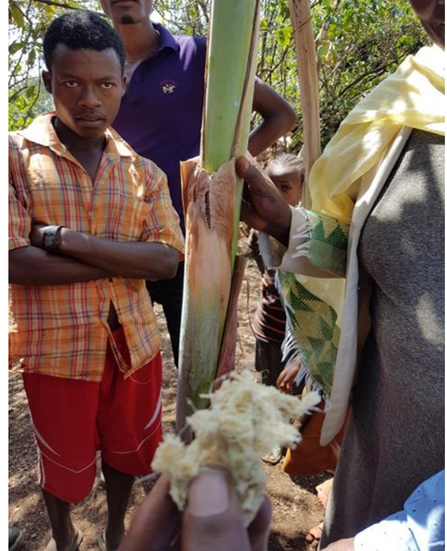
Immagine di Enset, «Falso banano», la cui corteccia viene mangiata quando non c’è nessun altro cibo disponibile

Volendoci soffermare su un caso concreto quale l’Etiopia, secondo le Nazioni Unite, l’84,0% della popolazione non può permettersi una dieta sana (il che significa una spesa di 3,39 dollari al giorno), il 47,7% non può permettersi una dieta adeguata in termini di nutrienti (il che significa una spesa di 1,94 dollari al giorno) e l’1,7% della popolazione non può nemmeno permettersi una dieta sufficientemente energetica (il che significa una capacità di spesa inferiore a 0,58 dollari al giorno) .