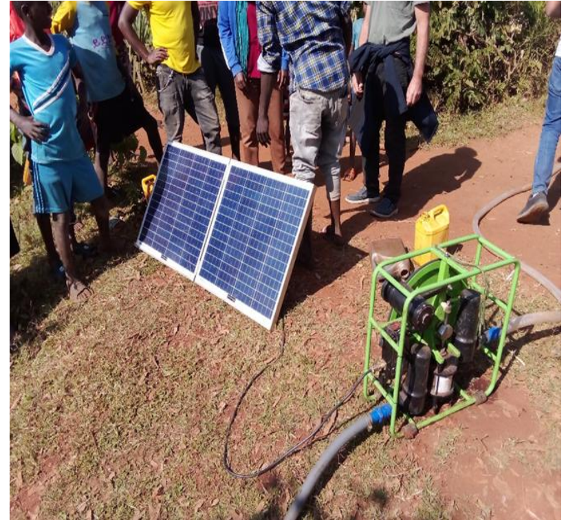
Pompa mobile per l’irrigazione con l’energia solare