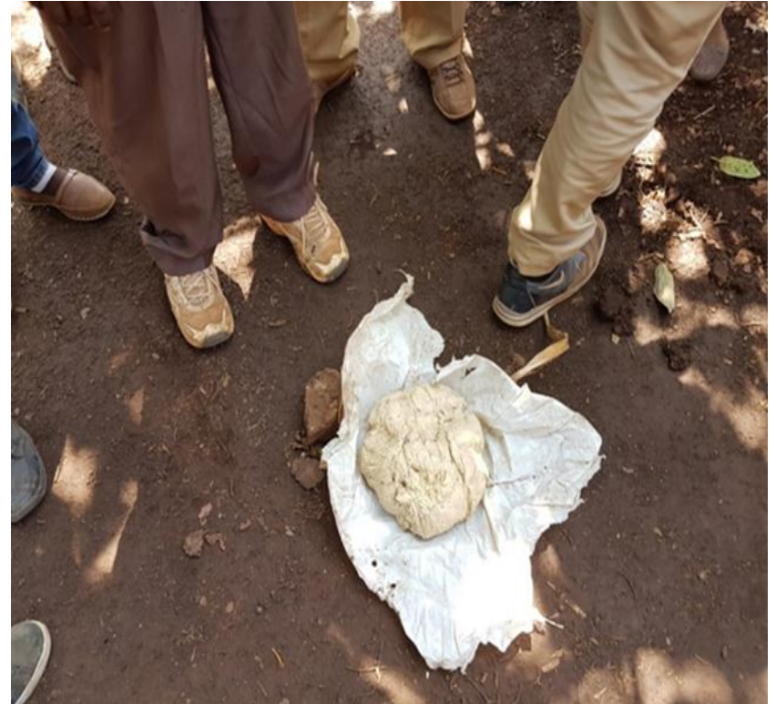
Una «pagnotta» fatta con la corteccia dell’enset

Nel 2021 il numero di persone sottanutrite in Etiopia ha raggiunto i 28,6 milioni (24,9% della popolazione totale), il numero delle persone con grave insicurezza alimentare ha raggiunto i 22,6 milioni (19,6% della popolazione totale) e, nel 2020 , il numero di bambini (sotto i 5 anni di età) affetti da deperimento è stato di 1,2 milioni (7,2%) e il numero di bambini (sotto i 5 anni di età) che presentavano ritardi di crescita ha raggiunto i 5,9 milioni (35,3%). In tutta l’Etiopia la povertà rurale è un fenomeno radicato e diffuso e, in particolare, nel Sud.