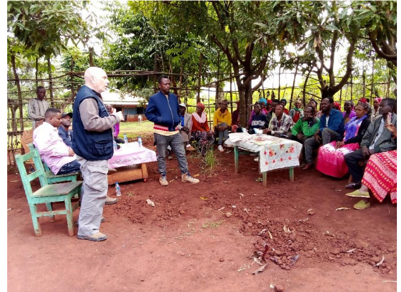
Un incontro con i contadini del Wolaita