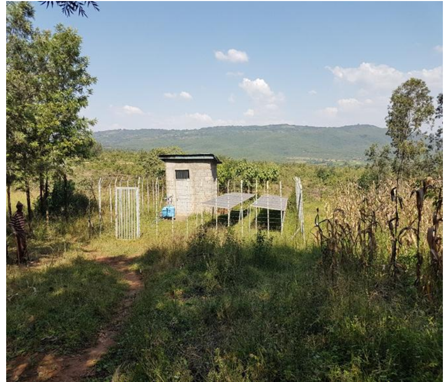
L’impianto di irrigazione alimentato da energia solare realizzato in Wolaita, Sud Etiopia