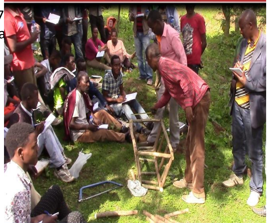
Formazione di agricoltori sulla costruzione di arnie con materiali naturali